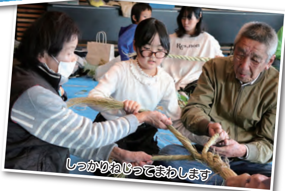
しっかりねじってまわします