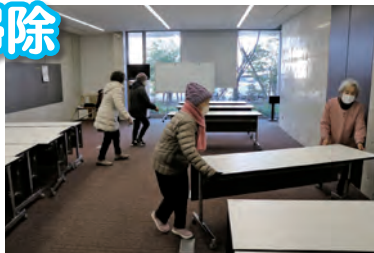
きれいになりました

12月26日(金)、秋穂地域交流センター利用者協議会の皆さんが、交流センターの大掃除をしてくださいました。ピカピカになった交流センターで、新しい年を迎えることができました。ありがとうございます。