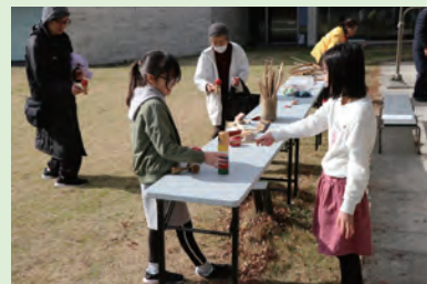
昔の遊びを楽しみました