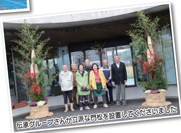
伝承グループさんが立派な門松を設置してくださいました