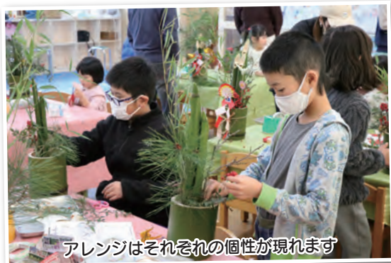
アレンジはそれぞれの個性が現れます