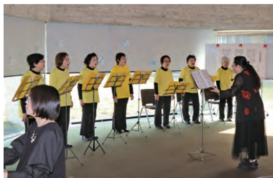
美しい歌声でした

コールなの花 ウィンターコンサート 12月21日(日)、秋穂地域交流センター大会議室で、「コールなの花」の皆さんと音楽の仲間たちが、「ウィンターコンサート」を開催されました。コンサートでは、コーラス、ハーモニカ、フルートなど多彩な内容で、素晴らしい歌声や演奏が披露されました。