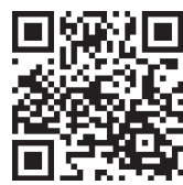
申込用 二次元コード