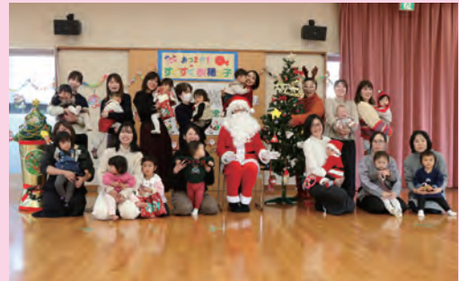
12月16日(火)すくすく秋穂っ子クリスマス会