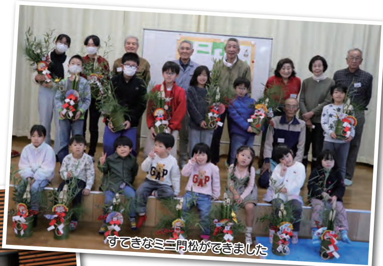
すてきなミニ門松ができました