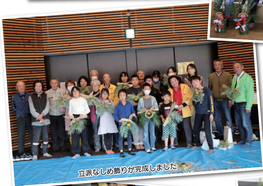
立派なしめ飾りが完成しました