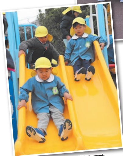
ピカピカの遊具です