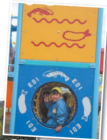
秋穂らしいEBIのデザイン