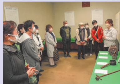
「使ったことがある」との声もありました

3月26日(火)、秋穂総合支所の秋穂歴史民俗資料館展示室で、山口市歴史民俗資料館の学芸員によるギャラリートークが開催されました。この日は、秋穂の漁業や昔の暮らしに関する資料について説明がありました。懐かしい漁具や民具に、参加された皆さん、興味津々の様子でした。