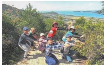
串山連峰で楽しみました

4月13日(土)、秋穂コミュニティセンターと秋穂地域交流センターの共催で、「みて！さがして！串山ハイキング」を実施しました。この日参加した14人の子どもたちは、ミッションを次々とクリアし、春の串山連峰の爽やかな風を満喫しました。