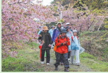
中津江さくらの里で