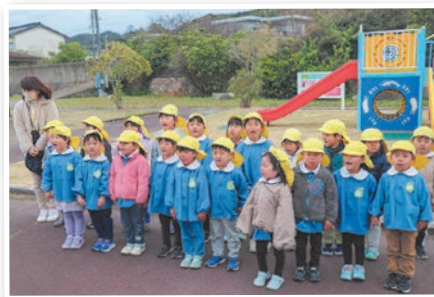
あいさつしました