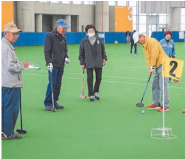
元気にプレイしました。

4月4日(木)、やまぐち富士商ドーム(きりらドーム)で、グラウンド・ゴルフふれあい大会が開催されました。年度当初の大会に参加された52人の皆さんは、グラウンド・ゴルフを大いに楽しみました。