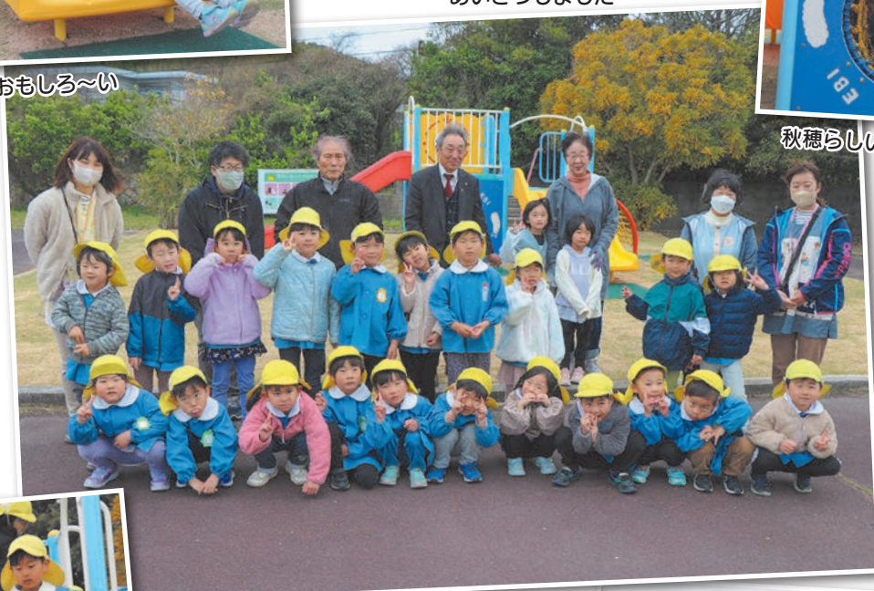
みんなで遊んだよ