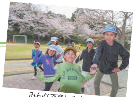
みんなで楽しみました