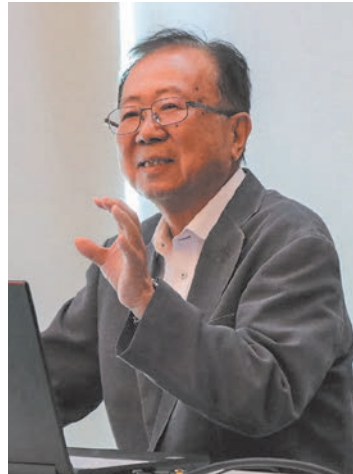
すばらしいお話でした