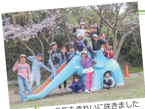
今年もきれいに咲きました