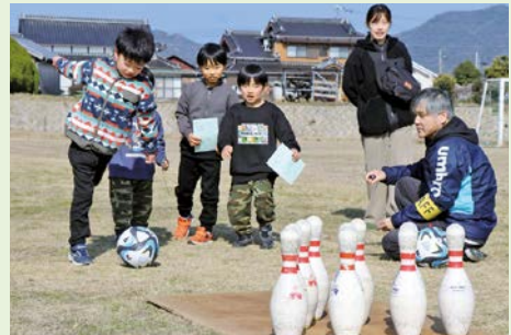
晴天の下楽しみました