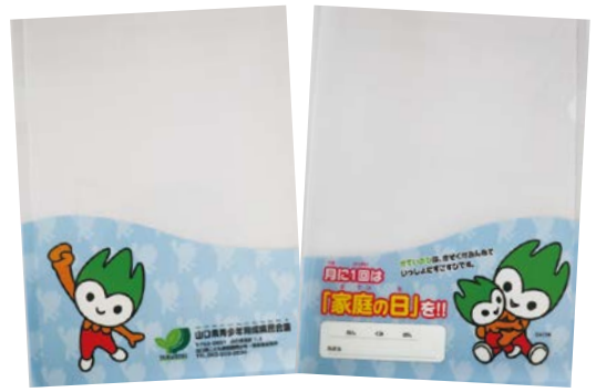
「家庭の日」クリアファイル

「家庭の日」クリアファイルを 贈呈しました 山口市青少年健全育成市民会議 秋穂支部