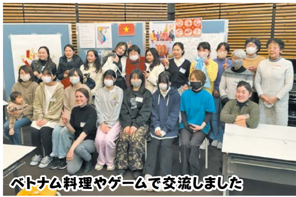
ベトナム料理やゲームで交流しました

1月27日(土)、多文化共生推進委員会やまるち主催による「ベトナム料理&多文化交流 in Aio」が、秋穂地域交流センターで開催されました。秋穂在住の様々な国の皆さんが参加され、ベトナムの文化を学び、一緒にベトナム料理の「バインセオ」と「チェー」を作っていました。また、自国のお正月の習慣について紹介し、ベトナムのサイコロゲームを楽しみながら、交流を深めることができました。