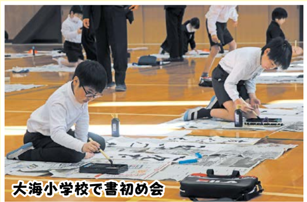
大海小学校で書初め会