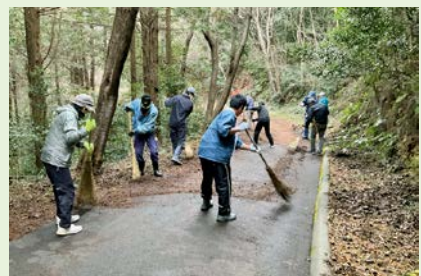
すばらしくきれいになりました