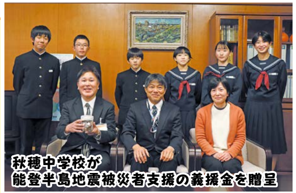
秋穂中学校が能登半島地震被災者支援の義援金を贈呈

秋穂中学校生徒会は、能登半島地震のニュースに触れ、生徒自身の発案で募金活動を実施しました。集まった義援金は、1月25日(木)日本赤十字社山口地区秋穂分会長(秋穂総合支所長)へ手渡されました。生徒たちの温かい気持ちは必ず被災地に届くことでしょう。