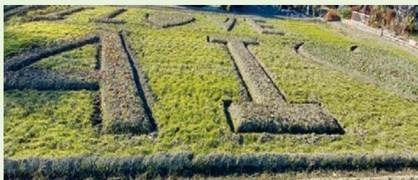
小学生と地域で植えた菜の花(中野)

2月11日(日)、35人のボランティアさんの作業のお陰で、とてもきれいになりました。お花見が楽しみです。