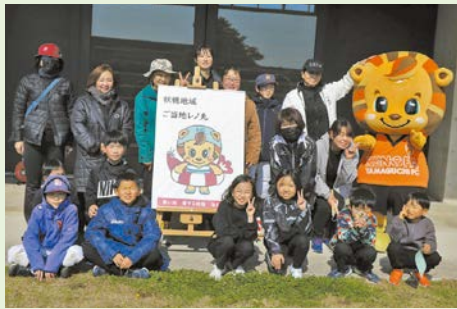
秋穂レノ丸のお披露目