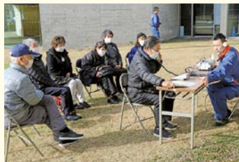
119番通報を体験しました

消防座談会では、住宅防火のおはなしや危険予知トレーニング、消火や煙体験などがあり、参加された皆さんは、しっかり防火意識が身についた様子でした。