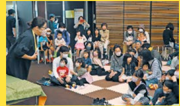
前回のこどもワイワイとしょかん

プログラムはただ今調整中。みんなの大好きなヨーヨー釣りやお菓子釣りは、もちろんやります。ほかにも楽しい企画をたくさん盛り込もうと考えていますので、乞うご期待！詳細は4月号でお知らせします。