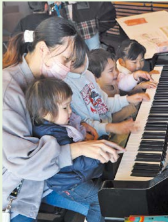
ストリートピアノも

2月12日(月・振替休日)、秋穂地域交流センターで、「カムカム〇〇(まるまる)inあいお」を開催しました。この日は、ストラックアウト、卓球、バスケット、キックターゲット、和太鼓、ストリートピアノ、レザークラフトなど様々な体験交流が行われ、大いに盛り上がりました。