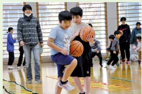
アリーナ会場も盛り上がりました

また、イベントでは、おしゃべりカフェに参加された皆さんのアイデアを元に生まれた「秋穂地域ご当地レノ丸」の披露も行われました。