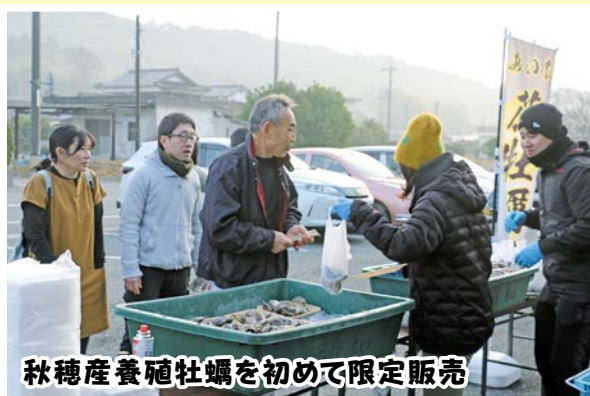
秋穂産養殖牡蠣を初めて限定販売

山口県漁協吉佐統括支店山口支所が取り組んでいる秋穂湾で養殖した牡蠣が、12月30日(土)秋穂漁港での朝市で初めて限定販売されました。