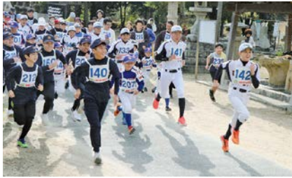
寒い中がんばりました

1月7日(日)、赤崎神社をスタート・ゴールに、「新春走ろう大会」(秋穂陸上競技協会・秋穂地域交流センター共催)が開催されました。今年の大会には、78人のランナーが参加し、少し肌寒い中、心地よい汗を流し、約3キロのコースを走りました。