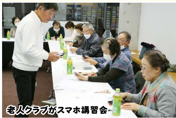
老人クラブがスマホ講習会

この日は、持ち帰り用のほか、「蒸し牡蠣」も販売され、買ってすぐに食べることもでき、皆さん「美味しい」と口を揃えておられました。