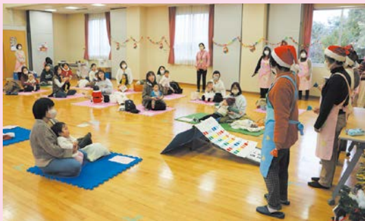
すくすく秋穂っ子クリスマス会 12月19日(火)、みんなでクリスマスを楽しみました♪