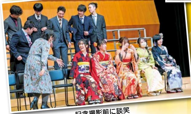
記念撮影前に談笑