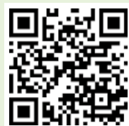
申し込み二次元コード