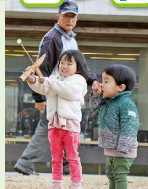
昔の遊びを楽しみました