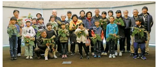
参加された皆さん