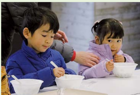
七草がゆ、おいしいね～