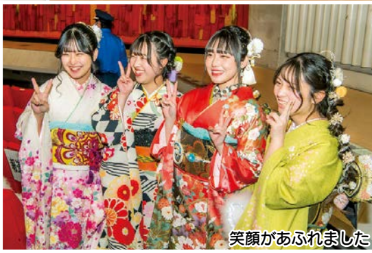
笑顔があふれました