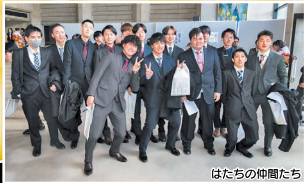
はたちの仲間たち