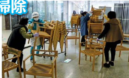
きれいになりました

12月26日(火)、秋穂地域交流センター利用者協議会の皆さんが、交流センターの大掃除をしてくださいました。ピカピカになった交流センターで、新しい年を迎えることができました。ありがとうございます。