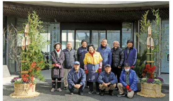
立派な門松を設置していただきました

12月25日(月)、秋穂地域交流センター大会議室で、年末恒例の「伝承しめ飾り教室」(秋穂地域交流センター・秋穂地区子ども会育成連絡協議会主催)を開催し、18人の親子が参加されました。 教室では、伝承グループの皆さんに、しめ飾りに使う材料の意味や作り方などを丁寧に教えていただき立派なしめ飾りが完成しました。また、秋穂伝承グループの皆さんは、今年も秋穂地域交流センターに「門松」としめ飾りを飾ってくださいました。