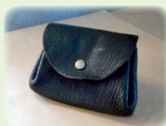
▲小物(小銭)入れサンプル