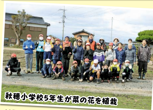
秋穂小学校5年生が菜の花を植栽

12月18日(月)中野の畑で、秋穂小学校5年生が、地域の皆さんといっしょに菜の花の苗の植え付けをしました。植える時期がやや遅いようですが、子どもたちは春のお大師まいり(今年は4月28日・4月29日)に合わせて咲くようにと、この日を選んだとのこと。春には黄色いきれいな花がお遍路さんに楽しんでいただけることでしょう。