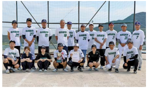
優勝した浜内チーム