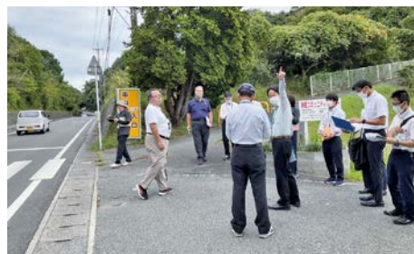
「どう危険か」を現地で確認しました

10月3日(火)、市教育委員会・道路管理者・警察署・学校・秋穂総合支所による通学路危険箇所の合同点検が実施されました。当日は、通学路の安全確保、早期改善について具体的な・専門的に検討がされました。