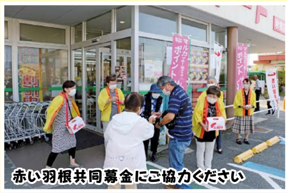
赤い羽根共同募金にご協力ください

10月4日(水)、東洋ヒューム管株式会社秋穂工場で、秋穂小学校の5年生21人が、黒漏開作のほ場に使用する大型水路のコンクリート壁に、農家さんに対するメッセージを描きました。子どもたちは未来にしっかり残していこうと、それぞれの思いを込めて描きました。