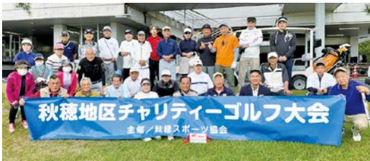
参加された皆さん