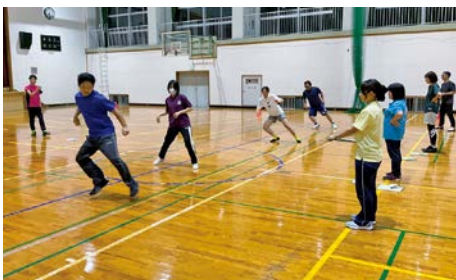
みんな、がんばりました

9月27日(水)、秋穂中学校体育館で、「スポーツ庁の体力測定」を開催しました。この日参加した9人の皆さんは、上体おこしや反復横跳びなど様々な体力テストにチャレンジしました。