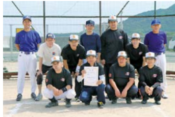
準優勝した北条チーム

10月1日(日)、大海総合センターグラウンドで、「秋穂地区対抗秋季ソフトボール大会(スローピッチ)」を開催しました。今回の大会には、8チームの参加があり、スポーツを楽しみ、大いに親睦を図りました。結果は次のとおりです。