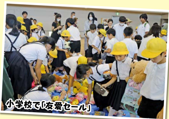
小学校で「友愛セール」

9月24日(日)秋穂小学校で、10月14日(土)大海小学校で、4年ぶりに「友愛セール」が開催されました。「友愛セール」は、家庭内の遊休品を学校に寄付していただき、売上金を児童たちのために使わせていただくものです。どちらの小学校も、たくさんの品物を出していただき、たくさんのお客さんが会場を訪れ、たくさん買っていただきました。