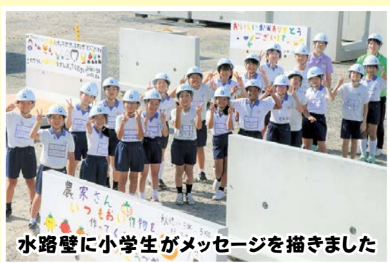
水路壁に小学生がメッセージを描きました

10月1日(日)、「ツールドヤマグチ湾2023」が、山口市南部地域をコースで開催されました。今回は、約250人の参加者が、8カ所のポイントを好きなルートを通って写真を撮る散策方式で行われました。秋穂のエイドステーションとなった大海総合センターでは、山口みかんのゼラートなどのおもてなしがありました。