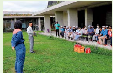
ためになるお話でした