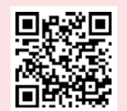
申込用二次元コード