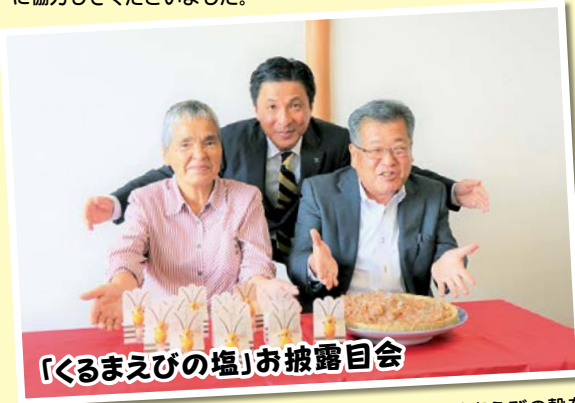
「くるまえびの塩」お披露目会

10月1日(日)、サンマート秋穂店前で、「赤い羽根共同募金」活動が、秋穂婦人会の皆さんにより行われました。多くの皆さんが募金に協力していただきました。