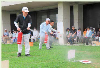
消火器を体験しました

9月21日(木)、秋穂地域交流センター中庭で、山口市南消防署秋穂出張所から講師を迎え、秋穂グランドゴルフ協会の皆さんに参加していただき「防火講習会」を開催しました。講習会では、火災時などの対応について基本的なことを教わりました。