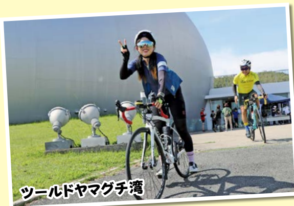
ツールドヤマグチ湾

9月24日(日)秋穂小学校で、10月14日(土)大海小学校で、4年ぶりに「友愛セール」が開催されました。「友愛セール」は、家庭内の遊休品を学校に寄付していただき、売上金を児童たちのために使わせていただくものです。どちらの小学校も、たくさんの品物を出していただき、たくさんのお客さんが会場を訪れ、たくさん買っていただきました。