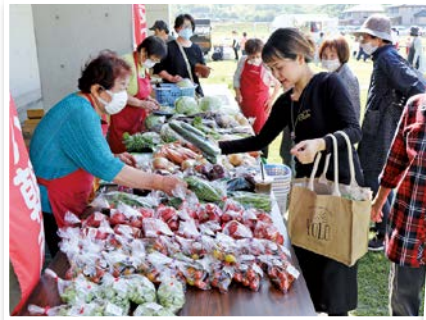
地元産品を販売しました