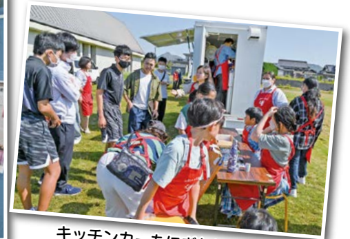
キッチンカーもにぎわいました