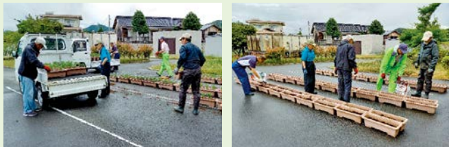
手際よく植えていきました

5月30日(火)、交流センターで春の花苗を植えました。小雨が降る中の作業でしたが5人の皆さんが、マリーゴールドの苗をプランターに植える作業に協力しました。きれいに咲いて交流センターを花で彩ります。