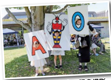
車シュリンプちゃんで記念撮影