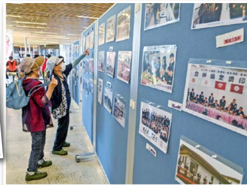
話が広がりました「平成の秋穂写真展」