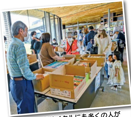
ブックリサイクルにも多くの人が