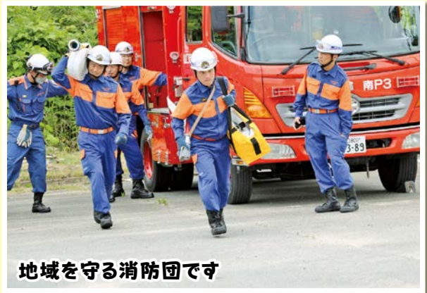
地域を守る消防団です

6月7日(水)、大海小学校4・5・6年生が、勤労体験学習として、田植えをしました。子どもたちは、体験を通して、食と農業への理解を深め、自然の大切さを学ぶことができました。