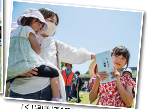
「くじ引き」で1等が当たりました!