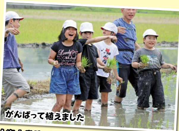
がんばって植えました