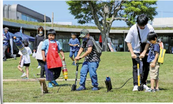
子どもたちもいっぱい楽しめました