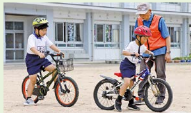
正しい自転車の乗り方を学びました

6月8日(木)と9日(金)、秋穂小学校で、3年生を対象とした自転車乗り方教室が行われました。この日は、南警察署のお巡りさんや山口南交通安全協会の方々、正しい自転車の乗り方をわかりやすく教えてくださいました。たのSEA秋穂づくり協議会安心・安全部会からは、交通安全シールを児童に贈り、それぞれの自転車に貼り付けました。