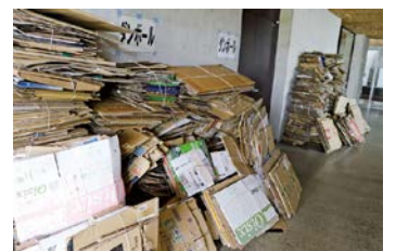
たくさん集まりました。ありがとうございました。

秋穂子ども会だより ご協力ありがとうございました 資源物回収に取り組みました 6月10日(土)から12日(月)まで、子ども会の活動として、たくさん資源物を集めていただきました。この資源物回収での収益は、秋穂子ども会の活動費になります。地域の皆さん、ご協力、本当にありがとうございました。