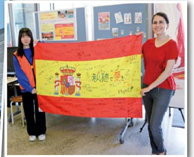
スペインを寄せ書きで 応援しました