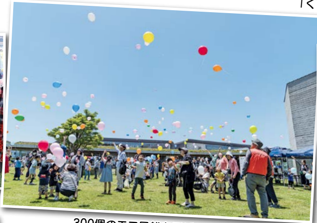
300個のエコ風船を飛ばしました