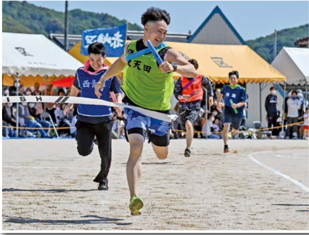
フェスタの花形「地区別リレー」