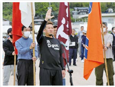
4年ぶりの「選手宣誓」