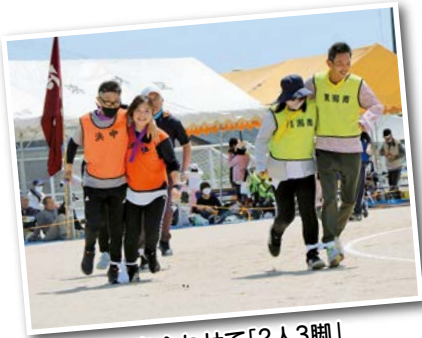
息を合わせて「2人3脚」