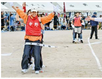
やったー! 1位だ!!「百足競走」