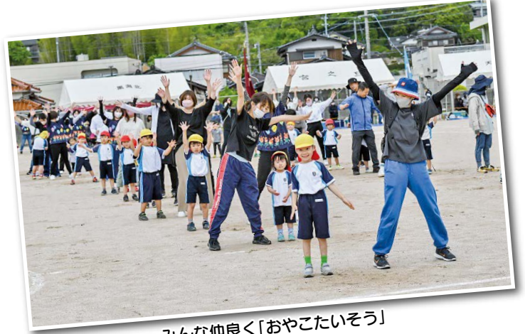
みんな仲良く「おやこたいそう」