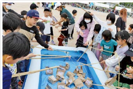
上手に釣れました「さかなつり」