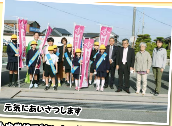
元気にあいさつします