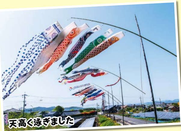
天高く泳ぎました

4月26日(水)、大海小学校で、3・4年生を対象に、「自転車の乗り方教室」が開催されました。子どもたちは、山口南警察署交通課のお巡りさんの交通安全のお話、自転車の正しい乗り方などのお話を一生懸命聴き、交通ルールを守ることの大切さをしっかり身につけました。