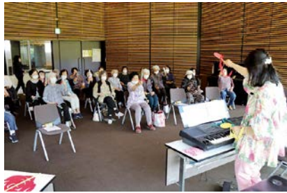
音楽で元気になりました

くしやま学級は、今年度も10回の開催を予定しています。学級生の皆さんは、毎回の学級を楽しみにしておられます。年度途中からの参加も可能ですので、あなたも参加されませんか。(秋穂地域在住のおおむね60歳以上の方が対象です)