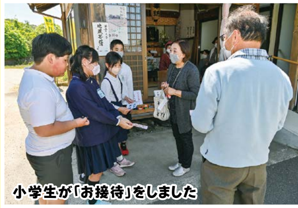
小学生が「お接待」をしました

秋穂地域では、各小学校・中学校が、「あいさつ運動」を実施しています。特に毎月1日には、3校がそれぞれ校門で、児童・生徒や先生、地域の皆さんが、登校時の児童・生徒を迎えて、一人ひとりに声をかけています。子どもも大人も、秋穂地域みんなでお互いに「あいさつ」を交わしていきましょう。(写真は令和5年度のあいさつ運動初日の4月13日(木)、秋穂小学校で)