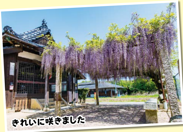
きれいに咲きました

弘法大師の命日である旧暦の3月20日・21日(今年は5月9日(火)・10日(水))、「秋穂八十八ヶ所お大師まいり」が行われ、お遍路さんなど多くの方々が札所を巡られました。今年は各札所が、少しずつ工夫しながら、それぞれの「お接待」をされている様子でした。また、今年は秋穂小学校の児童たちが「お接待」を体験しました。