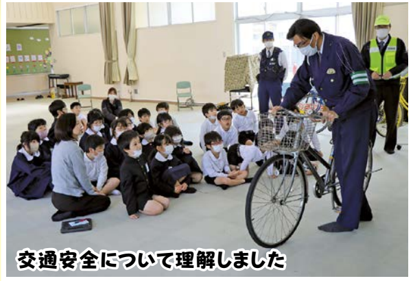
交通安全について理解しました

写真は、藤の花がきれいな札所である中野42番南条大師堂の4月20日の様子です。例年は、5月に満開を迎えますが、今年は桜など色々な花々が早く咲くようです。