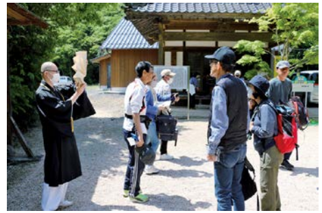
元気に歩きました

SPORTS CULTURE COMMUNICATION TEL 083(984)2132