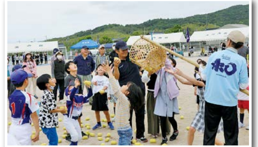
いくつカゴに入ったかな?「玉入れ」