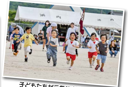
子どもたちが元気に走りました「走れチビッコ」