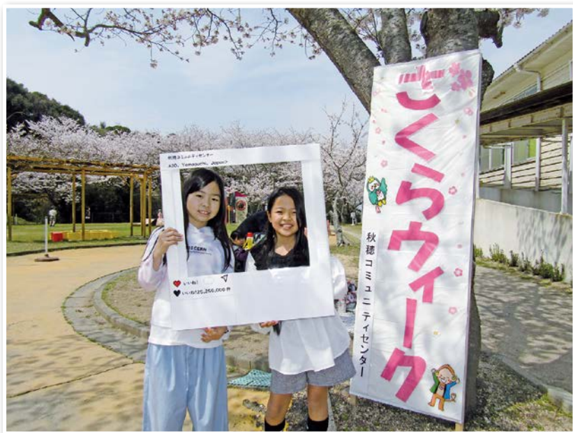
たのしい～コミュニティセンター