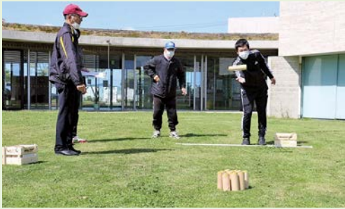
シンプルで楽しいゲームです

4月8日(土)、秋穂地域交流センターで、「モルック体験会」を開催しました。体験会では、簡単な説明の後、2人ずつのグループに分かれて①～⑫の数字が書かれた木の的(スキットル)に向かって木の棒(モルック)を投げて楽しみました。 皆さんもモルックを体験してみませんか。