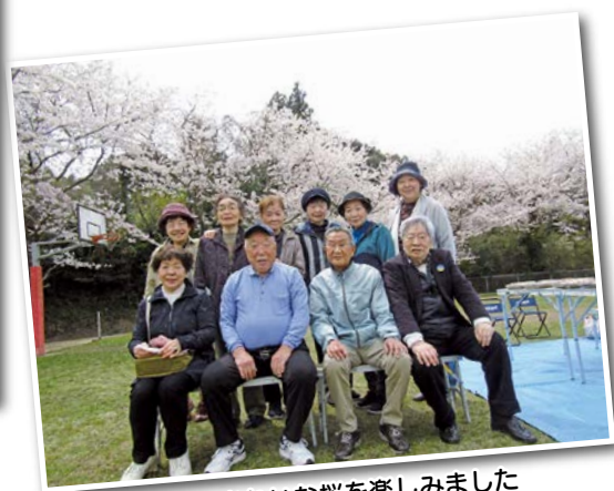
仲間できれいな桜を楽しみました