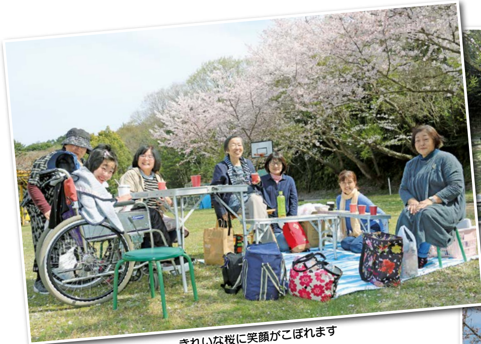
きれいな桜に笑顔がこぼれます