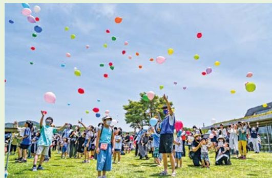
昨年のふれあいまつり