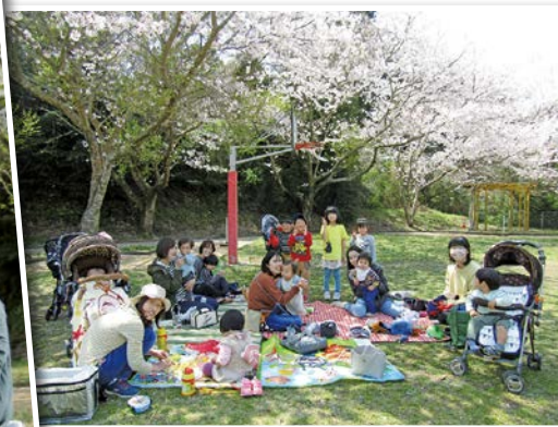
久しぶりのお花見会です