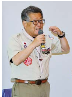
中身の濃い講演でした

4月16日(日)、秋穂地域交流センターで、「令和5年度生涯学習講座開講式」を開催しました。今年度司隊長による「私の生涯学習〜スカウト活動と共に歩んだ36年」と題した記念講演を聴講しました。ユーモアを交えながらの講演は、中身の濃い36年の深みのある内容でした。