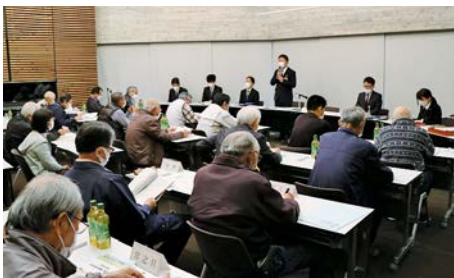
今年度の事業について話し合いました