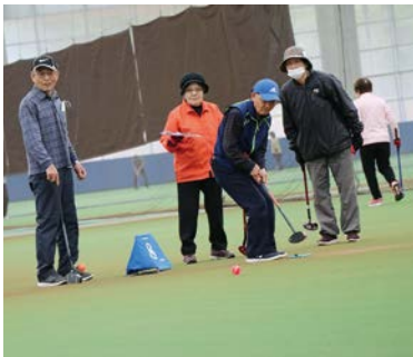
元気にプレイしました

4月6日(木)、やまぐち富士商ドーム(きくらドーム)で、グラウンド・ゴルフふれあい大会が開催されました。この日参加した皆さんは、グラウンド・ゴルフを楽しみながら親睦を深めていました。