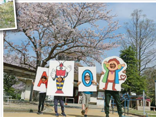
車シュリンプちゃんのくりぬきをつくってみました