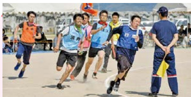
前回のスポーツ交流フェスタ