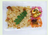
食推さんのお弁当