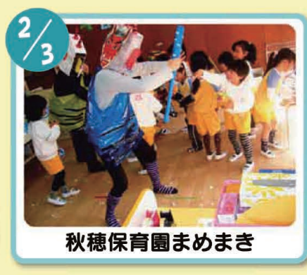
秋穂保育園まめまき