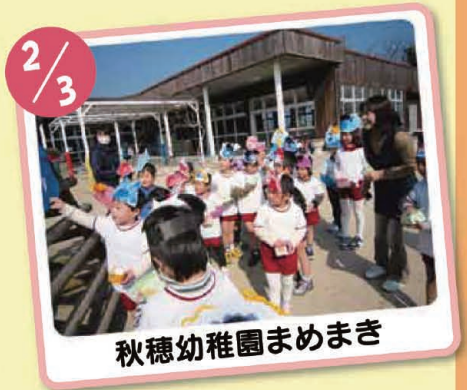
秋穂幼稚園まめまき