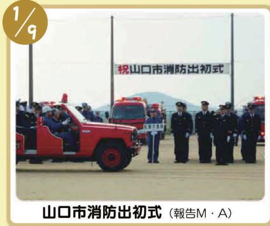
山口市消防出初式 (報告M・A)