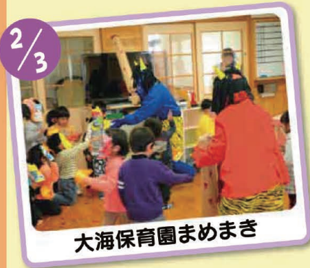
大海保育園まめまき