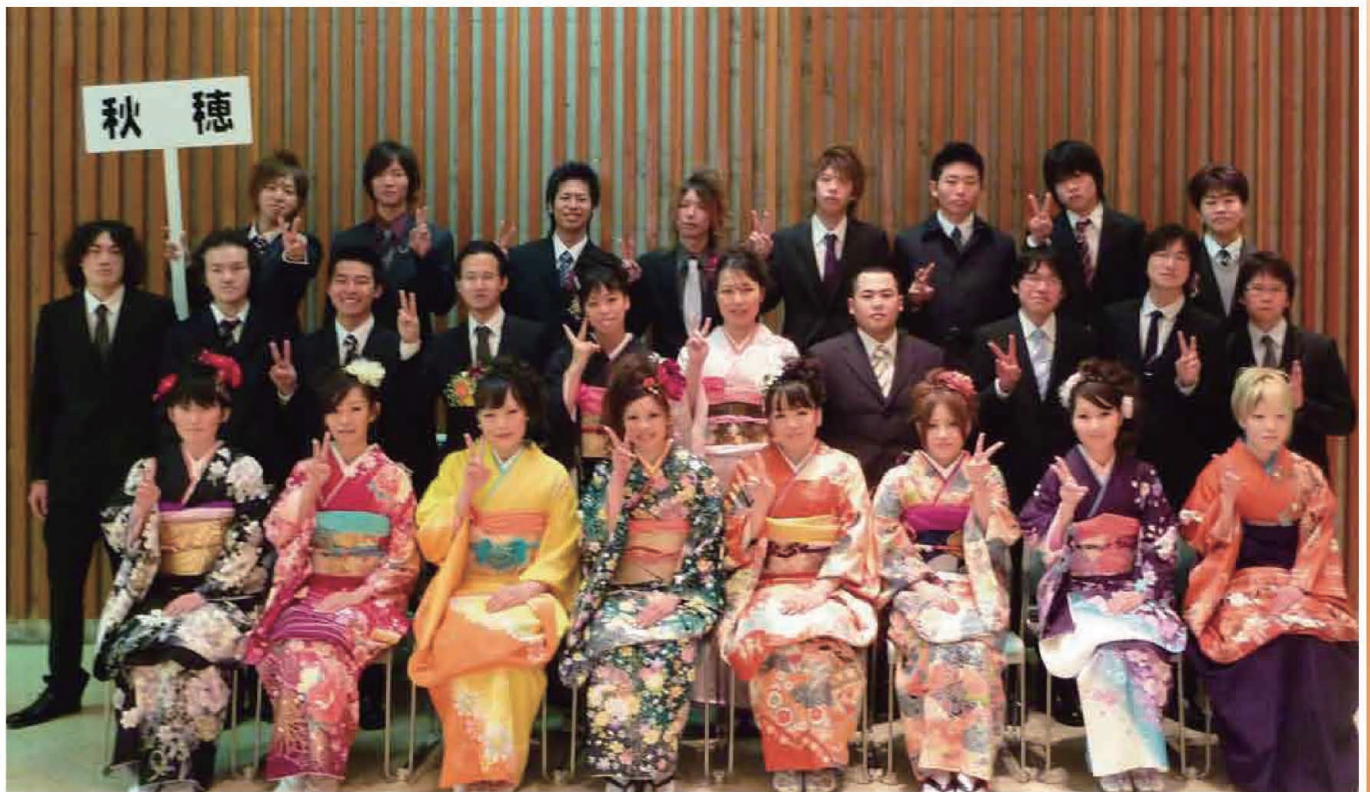
記念撮影には26人がおさまりました。

昨年まで阿知須きららドームで開催されていた成人式が、本年は山口市民会館で行われました。今年の秋穂地域の成人対象者は49人で、式には30人の出席がありました。