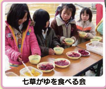
七草がゆを食べる会