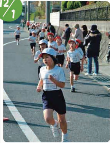
秋穂小学校持久走大会 (報告M・T)