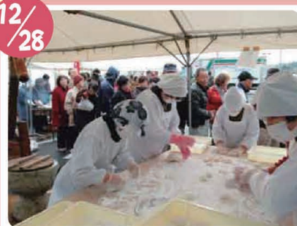
あいお道の駅まつり