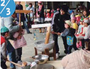
大海保育園もちつき会