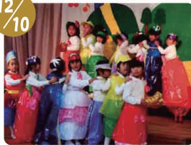
秋穂保育園クリスマス会