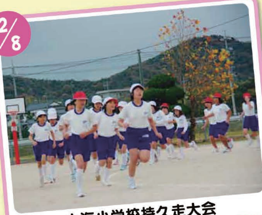
大海小学校持久走大会