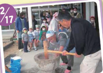
秋穂幼稚園もちつき会