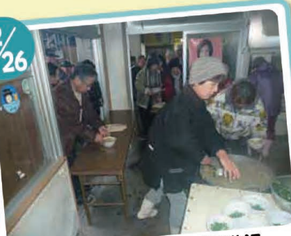
秋穂漁協・朝市 海鮮鍋