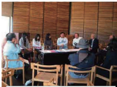
11/23 おもいで語りは 元気のもと Part II

秋穂の名物行事です。多くのランナー が健脚を競いました。沿道からは熱い声 援が飛び交いました。