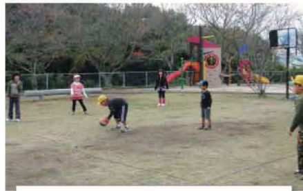
11/19 第5回にこにこ ドッジボール大会 コミュニティセンター