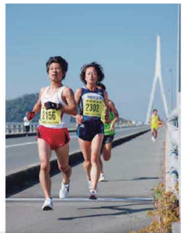
11/21 浜村杯秋穂 ロードレース大会

秋穂の名物行事です。多くのランナー が健脚を競いました。沿道からは熱い声 援が飛び交いました。