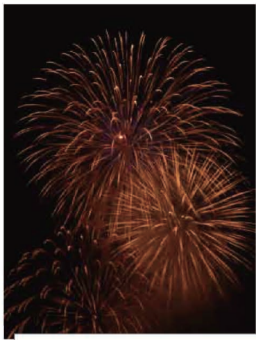
11/7 あいお花火まつり (報告M.T.)