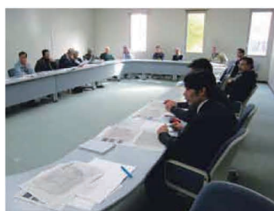
11/12 第3回草山公園整備 検討委員会