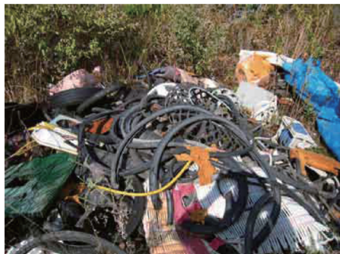
中道地区海岸周辺の不法投棄現場

秋穂地域では、長い海岸線を有し、山林もあって人目につきにくい場所が多いという特性から不法投棄が後を絶ちません。 不法投棄は5年以下の懲役または、一千万円以下の罰金が課される犯罪です。 市では不法投棄防止について、警察と協力して取組みを行なっておりますが、不法投棄を許さないためには、地域の皆さんの協力が欠かせません。 不法投棄についての情報または、「不法投棄防止啓発看板」設置についての相談等は、総合支所総務課までお問い合わせください。