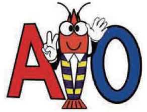
車シュリンプちゃん