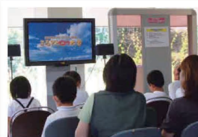
8/29 山口県ふるさとCM大賞

全国一斉クリーンアップ活動に参加された県央商工会青年部秋穂支部のみなさん(報告M.T.)