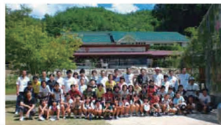
8/7・8 キャンプインあとう

ホンダカーズ山口さんが社会貢献活動の一環として、海岸清掃車を使って中道の砂浜をきれいにされました。