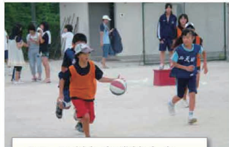
8/1 子ども会球技大会