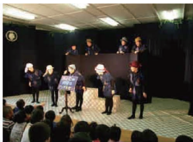
8/24 児童劇団がやってきた