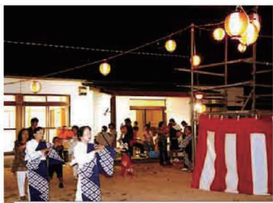
地区夏祭り 8/12 黒瀬南区 8/14 中野区