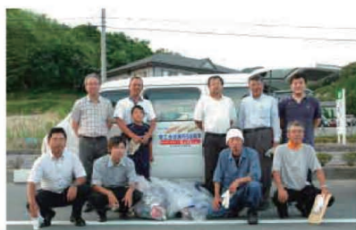
8/26 クリーンアップ全国大会

全国一斉クリーンアップ活動に参加された県央商工会青年部秋穂支部のみなさん(報告M.T.)