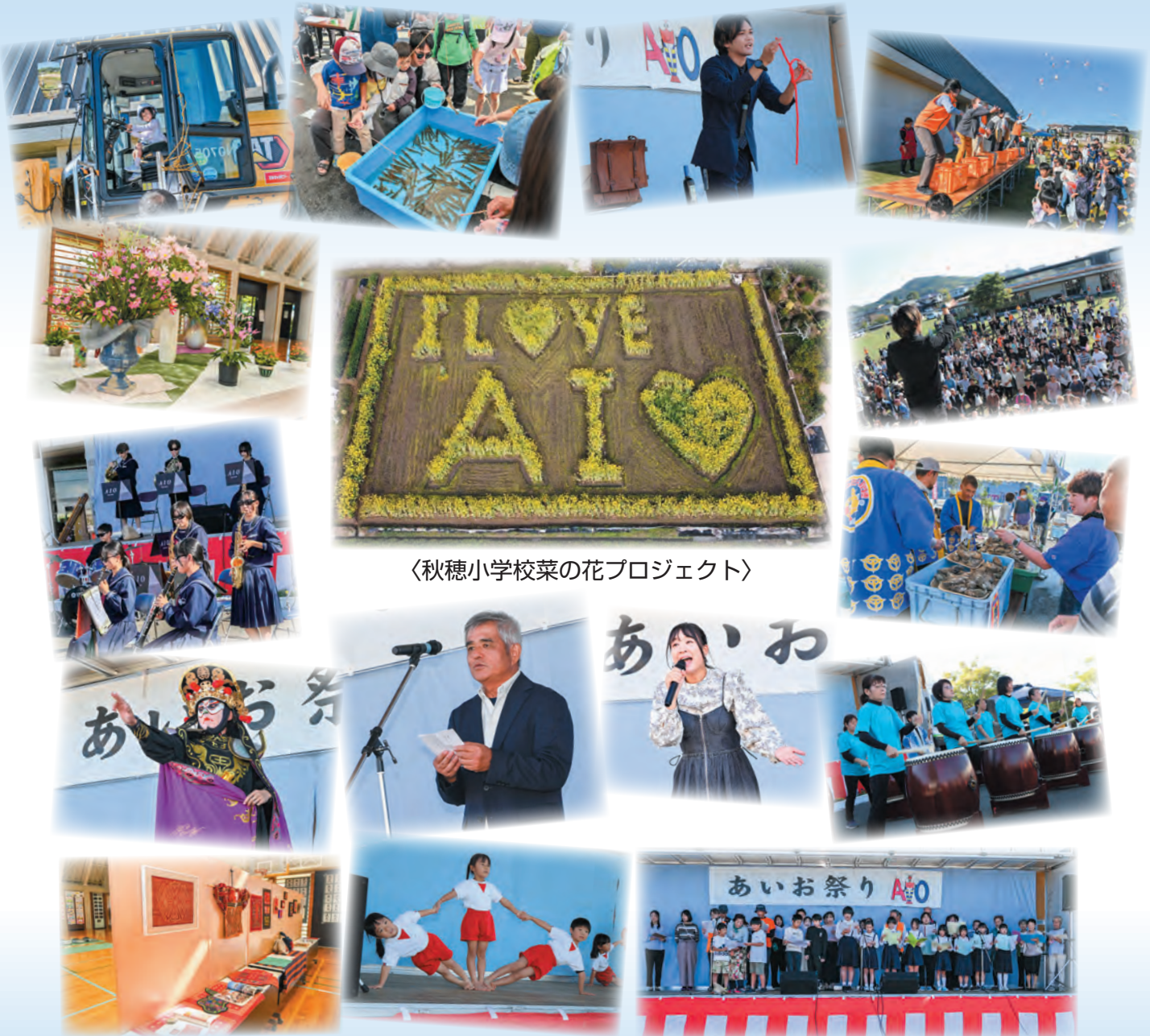
〈秋穂小学校菜の花プロジェクト〉